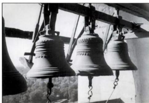
Часовые колокола Троице-Сергиевой Лавры, фото начала XX века