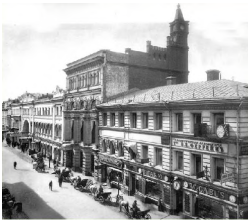
Рис.3. Аптека Феррейна в Москве на Никольской улице