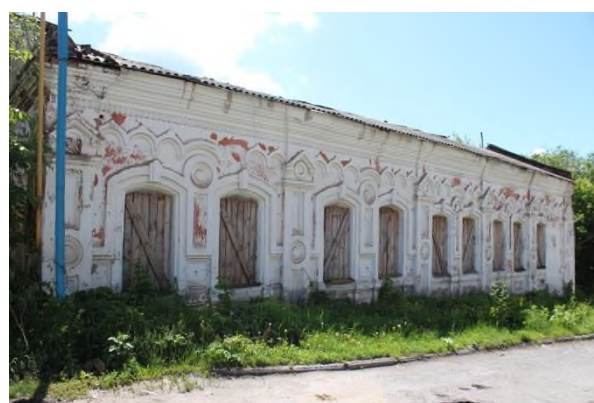
Рис.10. Здание аптеки Турминского до реконструкции