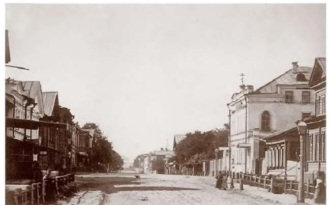
Рис.4. Первая городская аптека Нижнего Новгорода