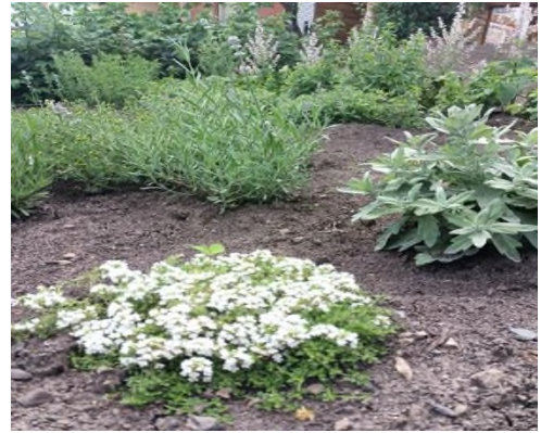
Рис.16. Аптекарская грядка дома на Пролетарской