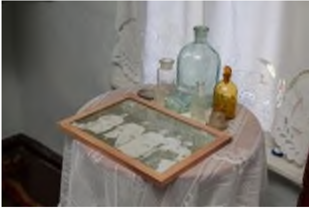
Рис.13. Экспонаты дома-музея Святителя Онуфрия на Пролетарской