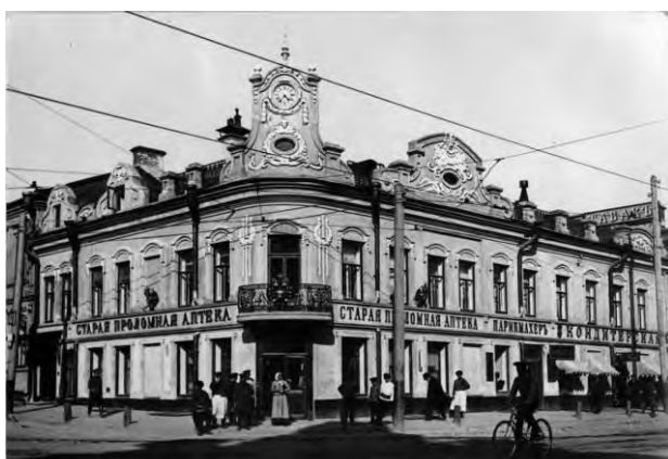
Рис.5. Старая проломная аптека Казани на Баумана