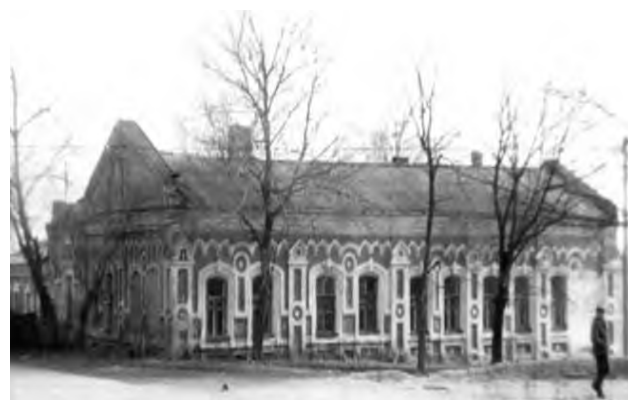
Рис.8. Аптека Турминского