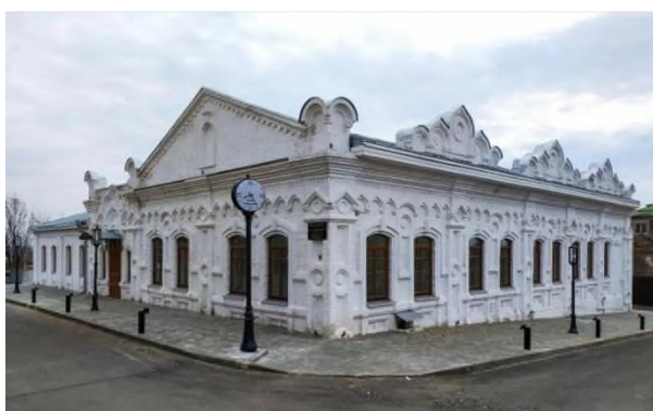
Рис.11. Здание аптеки Турминского в настоящее время