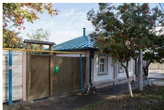
Рис.12. Дом-музей Святителя Онуфрия на Пролетарской