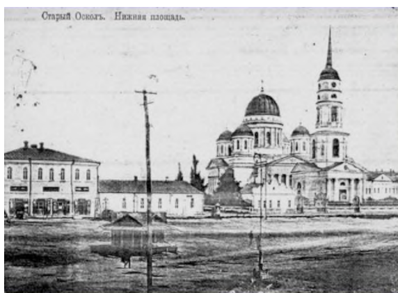
Рис.7. Нижняя площадь Старого Оскола