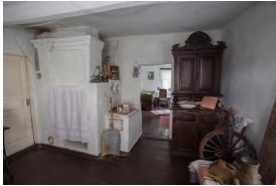
Рис.15. Интерьер дома-музея Святителя Онуфрия