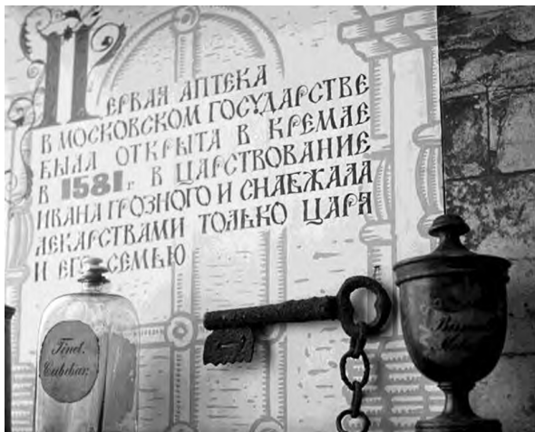
Рис.1. Первая царская аптека